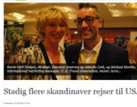
Stadig flere skandinaver rejser til USA